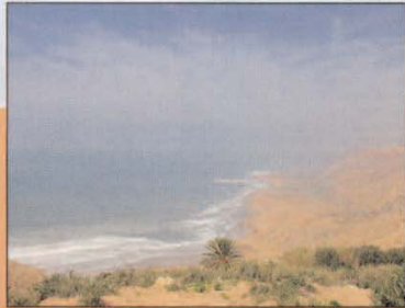
Au-dessus : Rivage près de Tunis À droite : Élaine Kibaro en récital